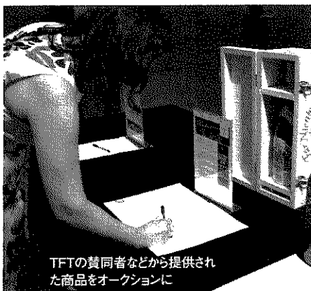
TFTの賛同者などから提供された商品をオークションに

ワインや料理に舌鼓を打ってもらうとともに、同プログラムの趣旨に賛同した企業や団体、個人から提供されたゴルフグッズや有名ホテルの宿泊券などを会場内でオークションやラッフル(慈善などを目的としたくじ)にかけ、その落札額および購入額を今後の運営